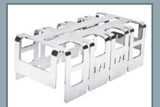
Übersicht von einigen Teilprodukten, die ITEQ fabriziert.